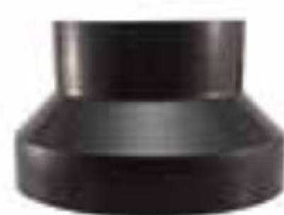
286 تبدیل | Reducer PN=4bar