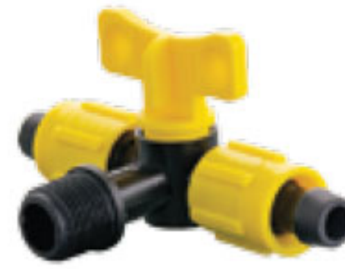
306 شیر سه راهی Triple Valve