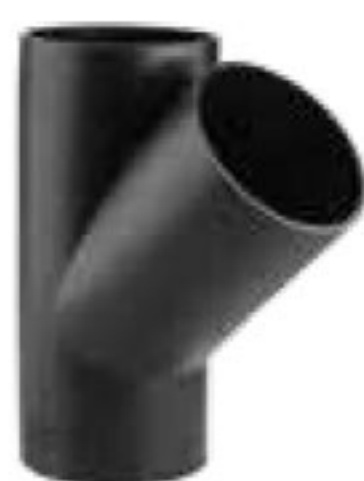
285 سه راه ۴۵° | 45° Tee