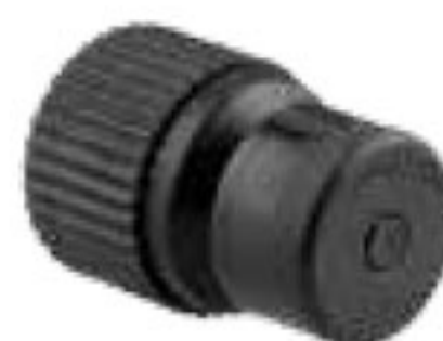
331 نازل بابلر Bubbler Nozzle