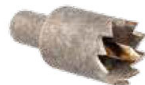
316 سرسته مخصوص بست ابتدایی تیپ