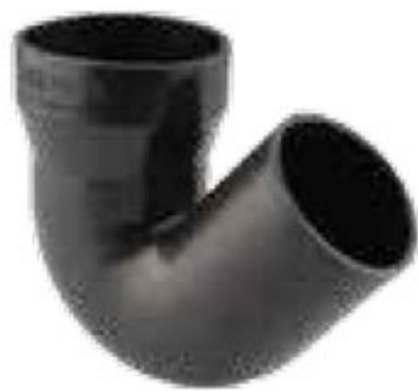
294 سیفون تبدیل | Reduced Syphon PN=4bar