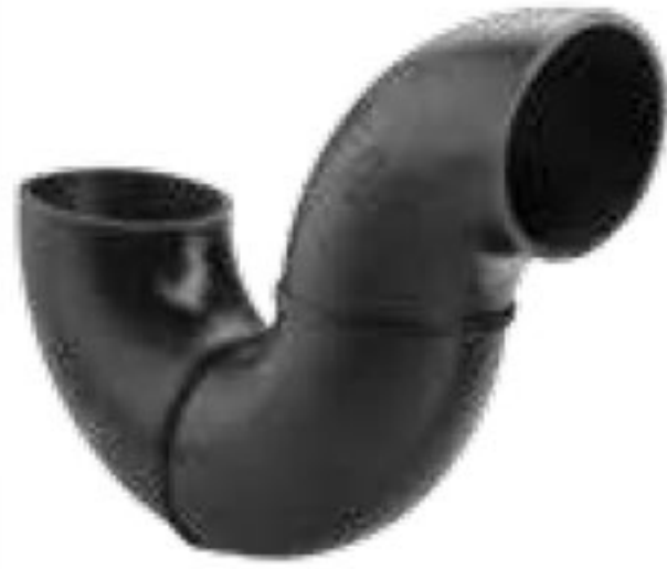
290 سیفون | Syphon PN=4bar