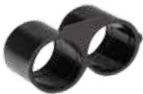
305 بست انتهایی End clamp