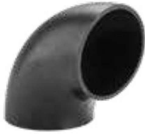
288 زانوی ۹۰° | 90° Elbow PN=4bar