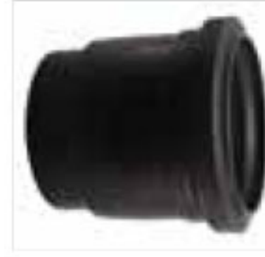
282 موفه کوتاه