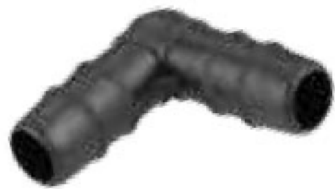
304 زانویی 16mm Elbow