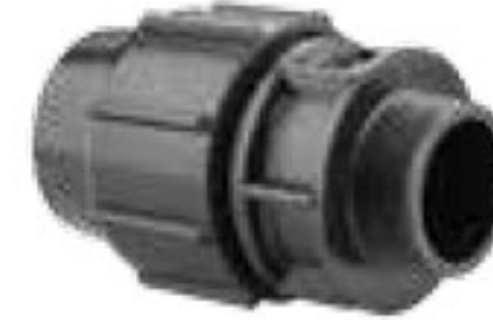
102 اتصالات نر Male Adaptor PN=10bar