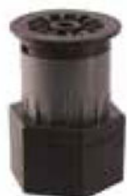
318 آبفشان Spreyer