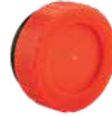
291 دریچه بازدید | Clean out with threaded Off take PN=4bar