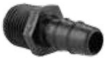
302 سرشستگی 16mm - 1/2" Male adaptor