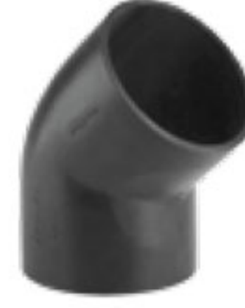
289 زانوی ۴۵° | 45° Elbow PN=4bar