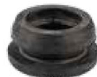
307 واشر بست ابتدایی 16mm Plug for off take