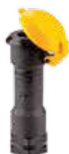
320 شیر خودکار Automatic Valve