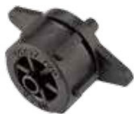
317 دریپر روی خط آبدهی: 8L/H تا 4 Drum dripper