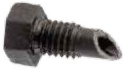
310 درپوش 6mm