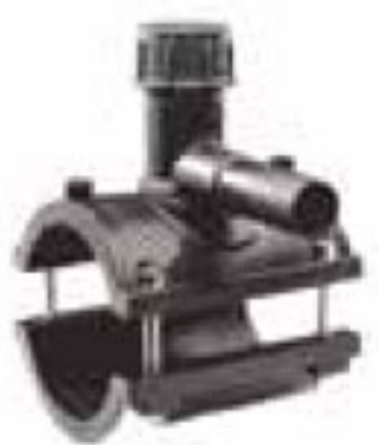
260 زین الکترو فیوژن Tee Tapping Saddles PN=16bar