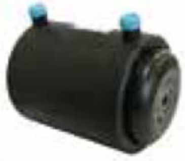
257 درپوش End Cap PN=16bar