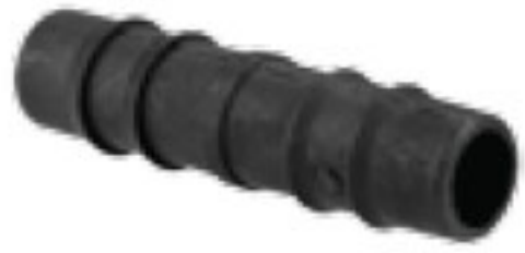
302 رابط 16mm Coupling