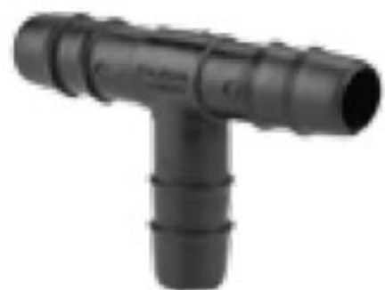
303 سه راه 16mm Tee