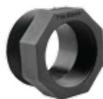
155 تبدیل نر / ماده