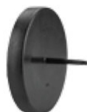
287 درپوش تست | End Plug PN=4bar