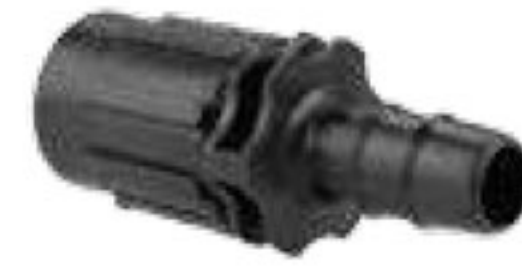
314 رابط تیپ به لوله 16mm