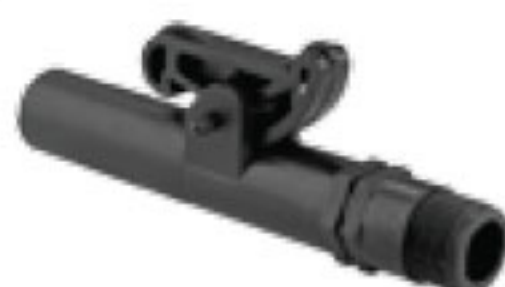
321 کلید شیر خودکار Key