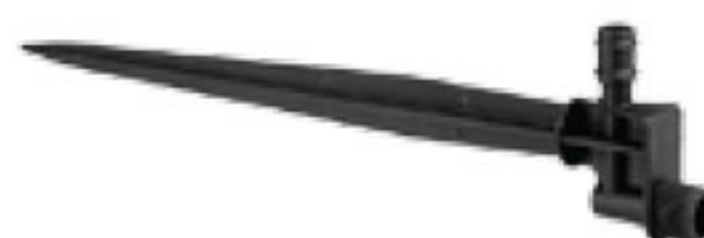
330 پایه بابلر Bubbler Basies