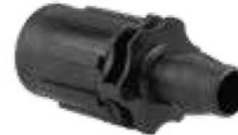
314 رابط تیپ به بست ابتدایی دنده‌ای