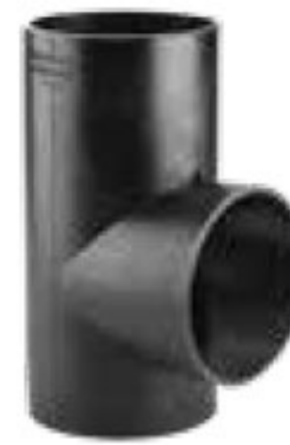
284 سه راه 90°