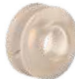
307 واشر سیلیکونی Silicon Oring 5/8"