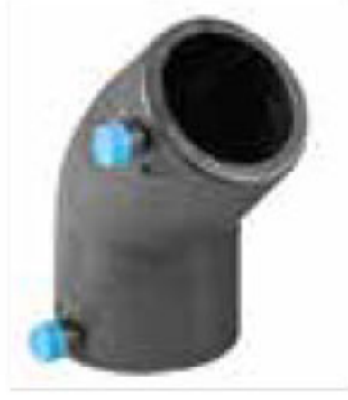
255 زانوی ۴۵° Elbow PN=16bar