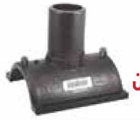
265 کمر بند الکترو فیوژن با خروجی استاندارد Saddles With Outlet PN=16bar