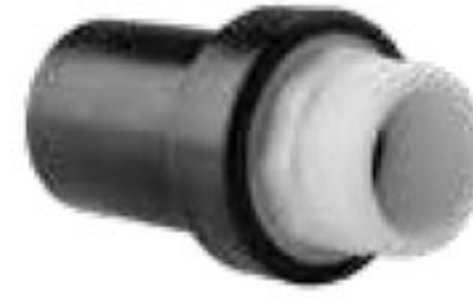
271 اتصال TF پلی اتیلن، برنجی، پلیمری Transition Fittings PN=16bar