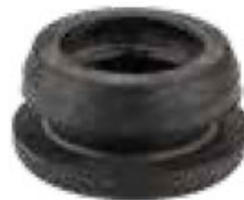
307 واشر بست ابتدایی 5/8" Plug for off take