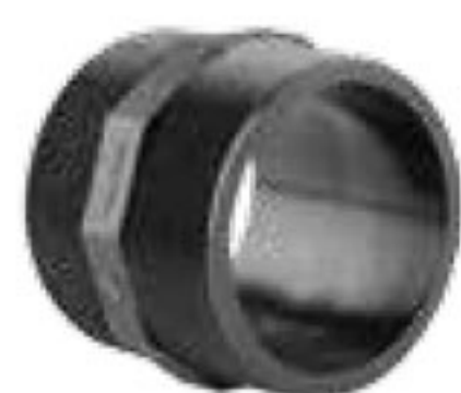
151 مغزی دنده ای