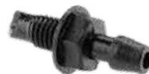
309 بست ابتدایی 6mm Start Connector