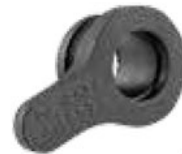
307 واشر بست ابتدایی تیپ Plug for lay flat off take