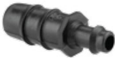
302 بست ابتدایی 16mm Reducing Coupling