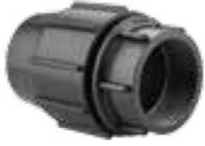
101 اتصالات ماده Female Adaptor PN=10bar