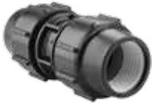
103 رابط Coupling PN=10bar