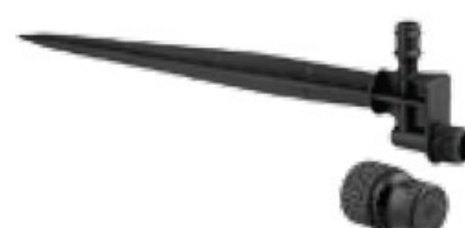
332 بابلر Bubbler