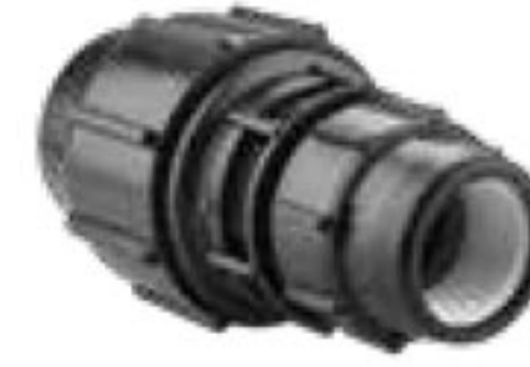
104 تبدیل Reducer PN=10bar