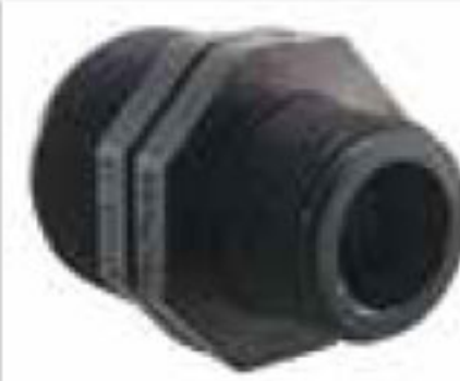
152 مغزی تبدیل