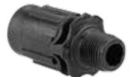
314 رابط تیپ به 1/2"