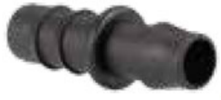
302 بست ابتدایی 5/8" Reducing Coupling