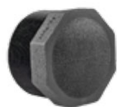
153 درپوش دنده ای