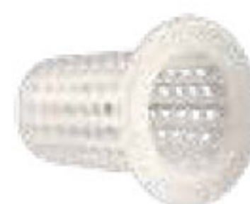
333 توری بابلر Bubbler Filter