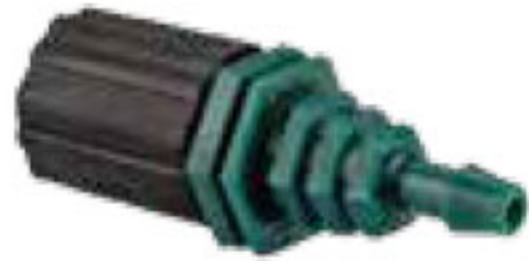
311 دریپر زیتونی