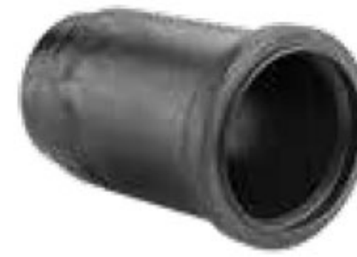
283 موفه بلند