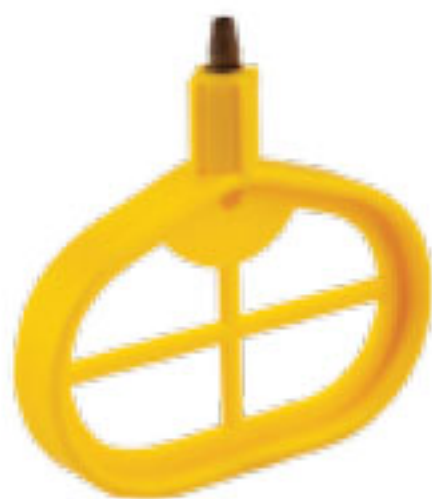
313 آچار پانچ