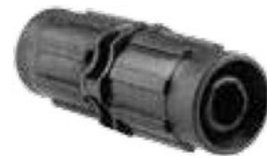
314 رابط تیپ به تیپ