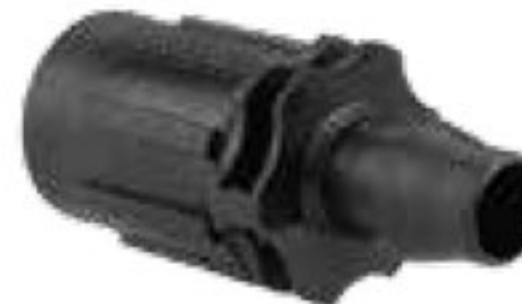
314 رابط تیپ به بست ابتدایی فشاری